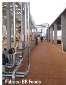
Fábrica BR Foods