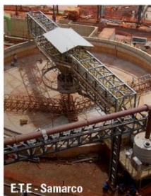
E.T.E - Samarco