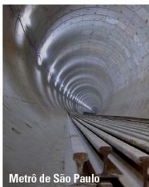
Metrô de São Paulo