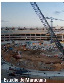
Estádio do Maracanã