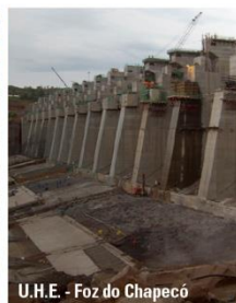
U.H.E - Foz do Chapecó