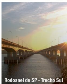
Rodoanel de SP - Trecho Sul