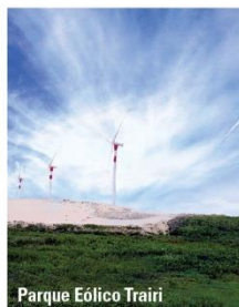
Parque Eólico Trairi